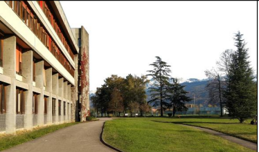
BÂTIMENT STENDHAL Projet SMART CAMPUS Humanités et Langues